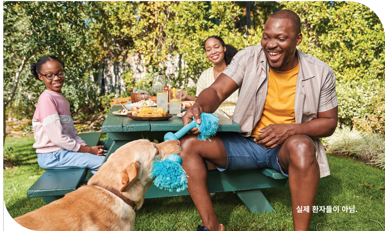
실제 환자들이 아님.

B형 간염이 있는 기간이 길면 길수록, 더 많은 손상을 일으킬 수 있습니다. 중증 간 손상 위험이 있기 때문에, 몸 상태가 괜찮더라도, 정기적으로 담당 의사의 진료를 받는 것이 중요합니다.