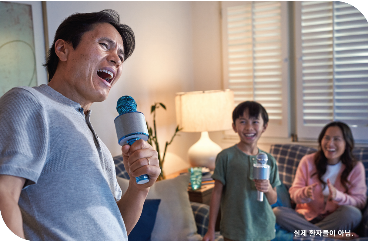
실제 환자들이 아님.