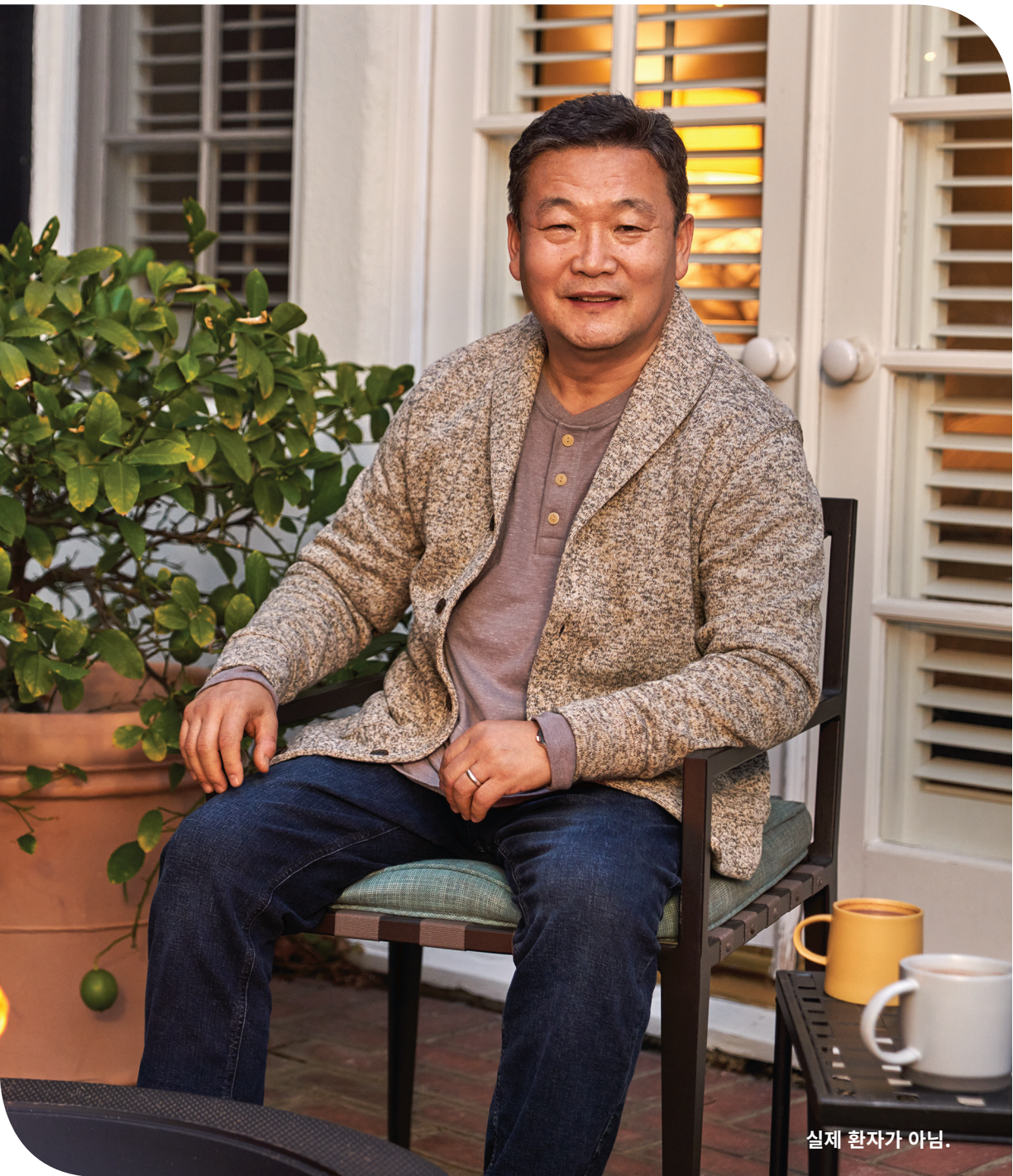
실제 환자가 아님.