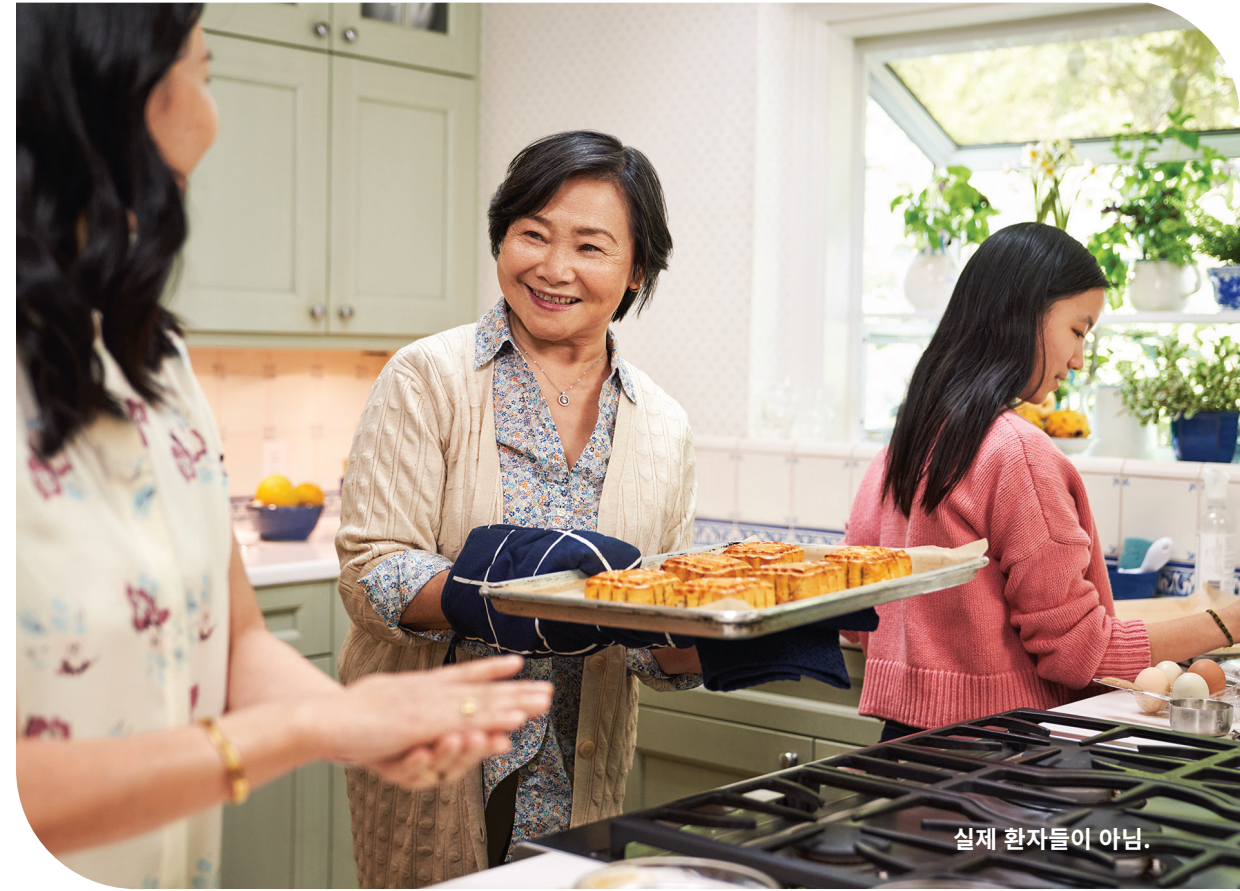
실제 환자들이 아님.

적격성과 등록에 관한 더 상세한 정보를 원하시면 www.vemlidy.com 을 방문하십시오.